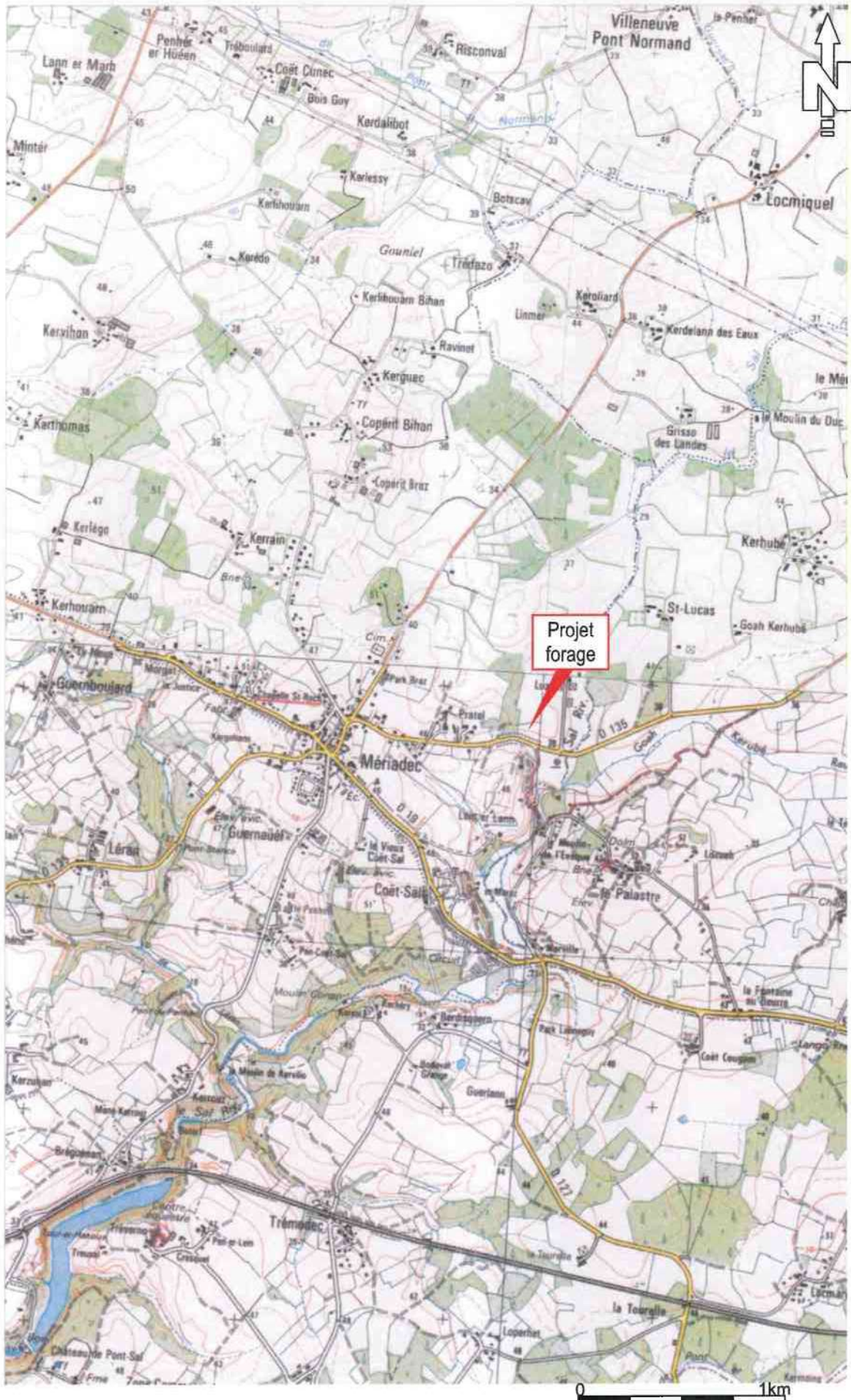
Figure 1 – Localisation du projet sur fond de carte IGN