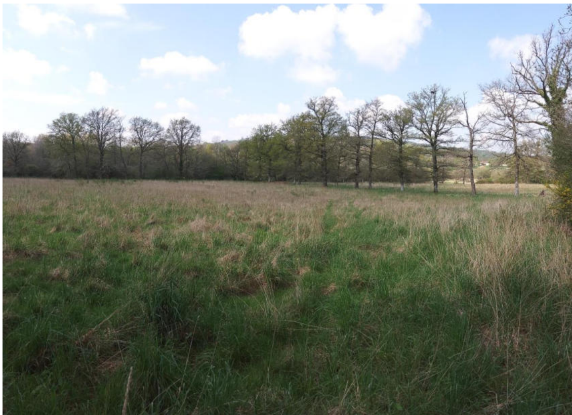
Prise de vue n°1 (environnement lointain).