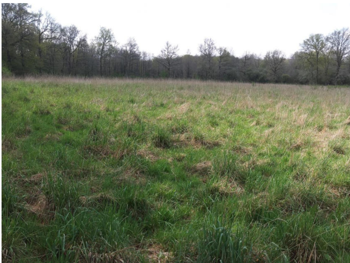
Prise de vue n°2 (environnement proche).